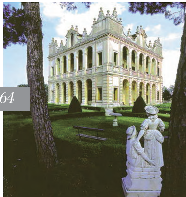
IN ALTO, LE SUGGERITIVE TERME EUGANEE QUI SOPRA, LA VILLA STORICA DEI CONTI EMO CAPODILISTA NEL PARCO REGIONALE DEI COLLI EUGANEI

F onte di benessere e relax, l'acqua termale è conosciuta sin dall'antichità per le sue proprietà terapeutiche e celebri erano le terme romane, precorritrici degli stabilimenti odierni, luoghi di benessere e socializzazione. Oggi il turismo termale si è sviluppato notevolmente e all'efficacia delle terapie viene associata anche l'alta qualità degli alberghi e della scelta gastronomica, che contribuisce a rendere l'esperienza termale una vera e propria vacanza all'insegna del relax e del benessere personale e di tutta la famiglia. Infatti, oggi la paletta di trattamenti e servizi è ampia e si adatta a tutte le esigenze, grazie a strutture moderne e all'avanguardia, che annoverano, oltre alle piscine interne ed esterne con acqua termale, sale per l'applicazione dei fanghi e per i massaggi, sauna, bagno turco e aree relax.